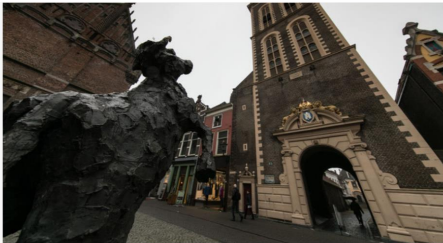
▲ Koe op het Koeplein in Kampen.